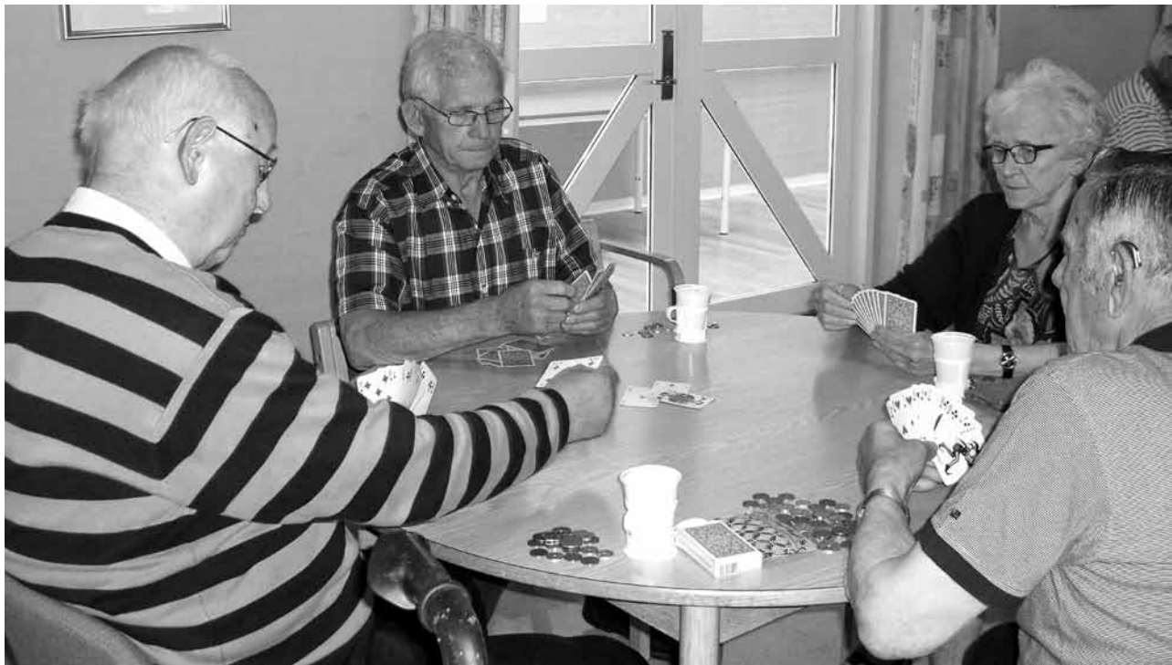
Hver tirsdag spilles der whist, der er to borde, men der er plads til flere, så kom og vær med.