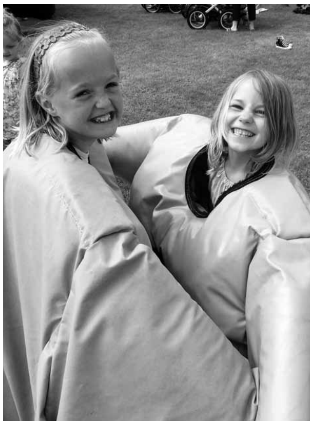
Glade sumo-bryder piger.