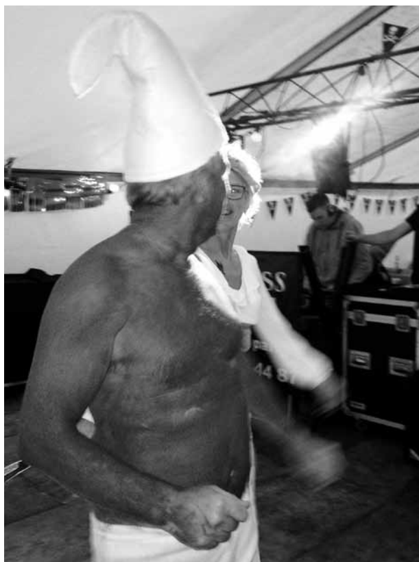
Gade-Smølf i piratkvindens klør

Traditionen tro blev det hele slået i gang om torsdagen med skattejagt for børn, hoppeborge, boder og tombola. Sidstnævnte er altid et tilløbsstykke – og i år var ingen undtagelse. Der var blevet doneret mange flotte præmier til formålet – og der skal lyde en stor tak til både præmie- og ølsponsorerne for alle bidragene!