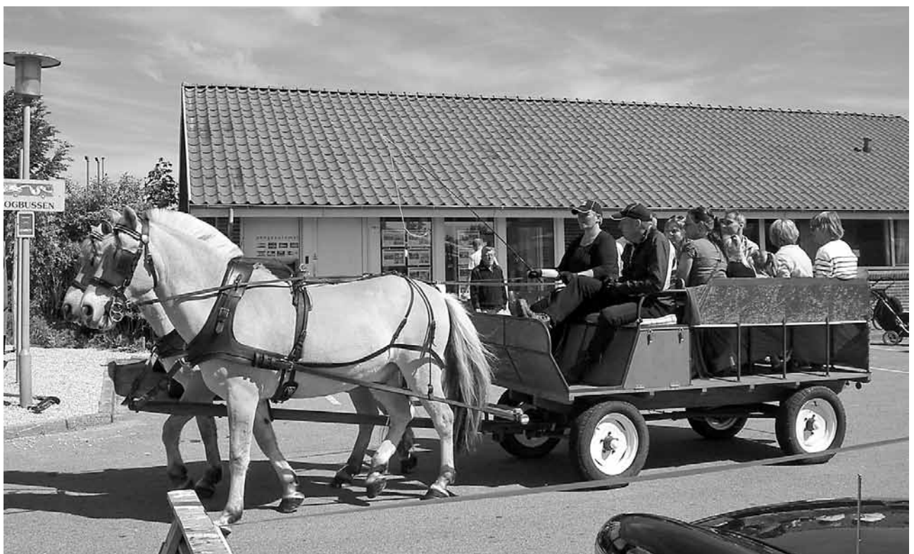
Hestevognen på vej til Nejstgården.