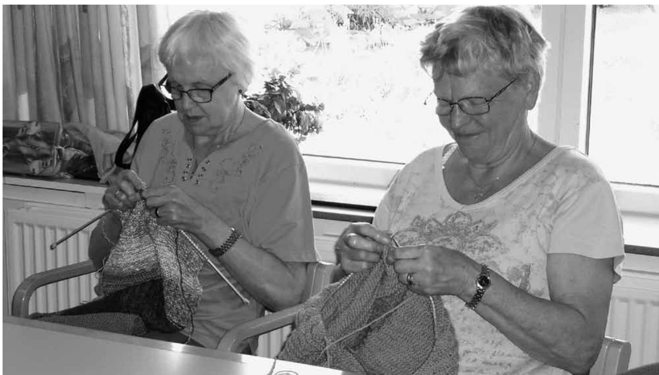
Strikkedamerne kommer flittigt hver tirsdag, sidste år fremstillede deres flittige hænder: 26 tæpper - 96 trøjer - 51 par sokker - 5 sjaler - 6 stk. diverse beklædningsgenstande - alle ting sendes til Rumænien. Du er også meget velkommen til at sidde med dit eget strikkesæt, nogen strikker sjaler, halsedisser med mere til sig selv, der flettes kurve i papirflet, og der laves kort til de forskellige fester. Har du problemer med dit håndarbejde så kom, der er sikkert én, der kan hjælpe. Der kan købes kaffe, alt det du kan drikke for kun 5,00 kr.