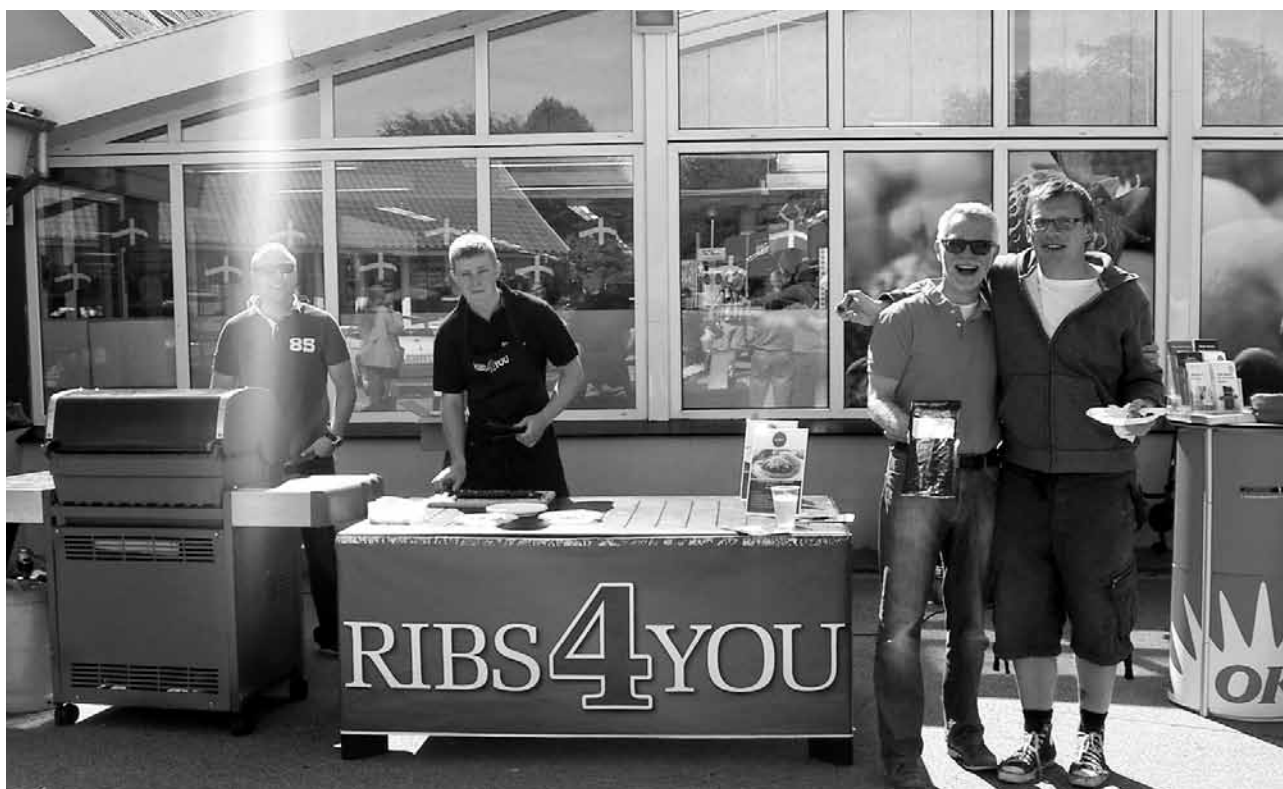
Smagsprøver ved indvielsen.